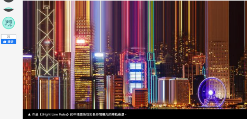
▲ 作品《Bright Line Rules》的中環景色被以類似特效片重新改造。

香港的城市景觀充滿科幻感，密密麻麻的高樓大廈並列而排，在感嘆以色列攝影藝術家Anat Givon的作品裏，還增加幾分超現實主義的視覺元素。她擅長以photoshop為香港熟悉的城市面貌帶來獨特的視覺效果，作品中也隱含著對於該城的精緻與想像。