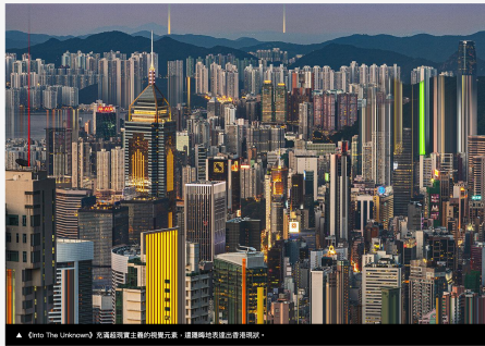
▲ 《Into The Unknown》充滿超現實主義的視覺元素，建構屬於自己的城市現狀。