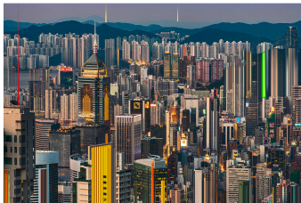
《Into The Unknown》