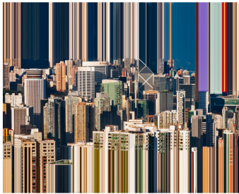
《View From My Window》

香港的城市景觀在題材和紙、世界最厚的高樓大廈並列而排，在罕見以色列攝影師安納·吉文(Anat Givon)的作品裏，透過技術手段展現主觀的獨特視覺，她擅長以photoshop為香港熱情的城市景觀帶來獨特的視覺效果，作品中也隱含著對於城市的權威感與想像。